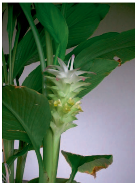
Abb. 1. Laubblätter und Blütenstand von Curcuma longa L. (Gelbwurz).

Die traditionelle indische Medizin, Ayurveda, verwendet Curcuma schon seit Jahrtausenden als reinigendes und entspannendes Arzneimittel.