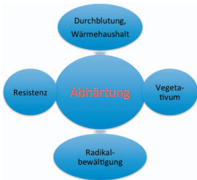
Abb. 1. Bei der Abhärtung spielen vielfältige Mechanismen eine Rolle.